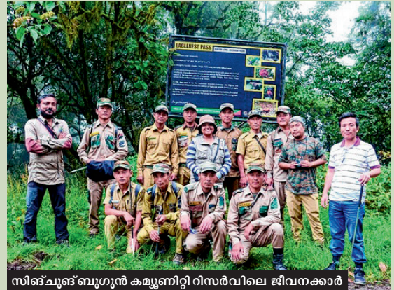
സിങ്ച്ചുങ് ബുഗുൻ കമ്മ്യൂണിറ്റി റിസർവിലെ ജീവനക്കാർ